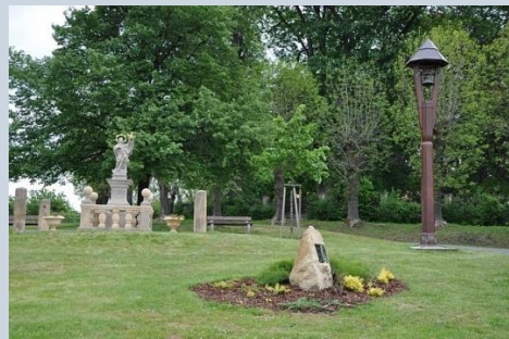
Náves v Kamenici se zvoničkou a sochou sv. Jana Nepomuckého